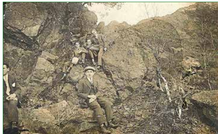
Výlet na Zdickou skálu, přelom 20. a 30. let minulého století.

Důvod, proč se skalka nazývá právě „Zdická“ ale bude možná mnohem prostší. Prosím nejprve, abyste nebrali níže zmíněné příklady jako konkrétní důvody – jsou to pouze příklady z nedávné historie obce (1. polovina 20. století), které mají pouze demonstrovat dříve dlouholetý provázaný vztah Kublov