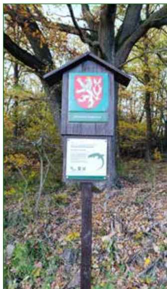
Současné označení PP Zdickej skalky, 2025.

- Zdice. Skalnatý hřbet Zdickej skalky se nachází jihovýchodně od obce, směrem ke Zdicím. V nedávné minulosti a ještě dříve, byly Zdice jedním z nejdostupnějších měst pro kublovské a broumské, kteří byli jinak izolováni od okolní