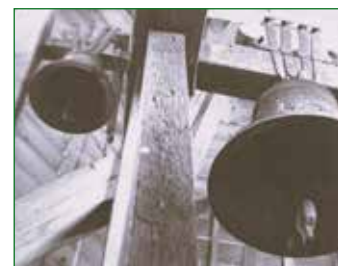
Kostelní zvony na Velízi, foto z roku 1942. Větší zvon byl ulit v roce 1605.

Zda se tato událost skutečně stala, nedokážeme říci. Jisté však je, že velizský kostel měl na počátku 17. století, kdy byl mimochodem ulit i dnešní kostelní zvon, ke Zdicím