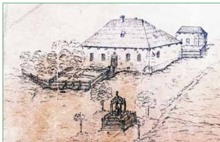
Nákres staré školy.

řých bývalo asi 80, vybírali na konci každého týdne takzvané sobotáles. Byly to poplatky odstupňované podle věku dítěte. Pro děti ve věku 6 – 8 let byl stanoven sobotáles v hodnotě 1 krejcaru, 8 – 10 let 1,5 krejcaru a 11 – 12 let 3 krejcarry. Tyto poplatky byly učitelům často placeny ve formě naturálií, jako jsou například různé zemědělské produkty a potraviny. Jak dlouho kublovský učitel vybíral sobotáles není zcela jasné, zda to bylo až do roku 1863, kdy bylo stanoveno pevné služné učitelů, nebo vybírání sobotáles skončilo již dříve, se neví.