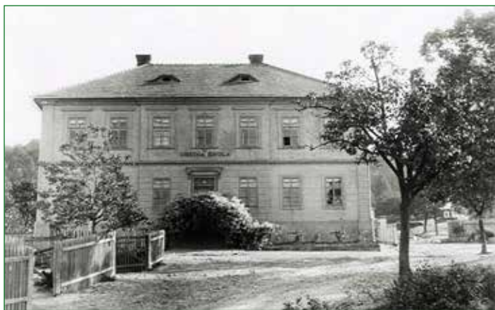
Fotografie pořízená zřejmě ihned po válce v roce 1945, kdy byla budova ve špatném stavu, protože koncem války zde byli ubytováni němečtí uprchlíci tzv. „národní hosté“ roku 1945.

Podle dokumentu s názvem „Zkoušební Výtah školních dítek patřících k farní škole Kublovské v roce 1863“ však v Kublově existovaly dvě třídy zcela určitě již v roce 1863. Zmíněný dokument je dokladem o hodnocení žáků školy při ka-