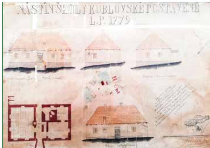
Plánek původní budovy školy postavené v roce 1802 (plán je datovaný rokem 1779, ale skutečně byla postavena škola v roce 1802)