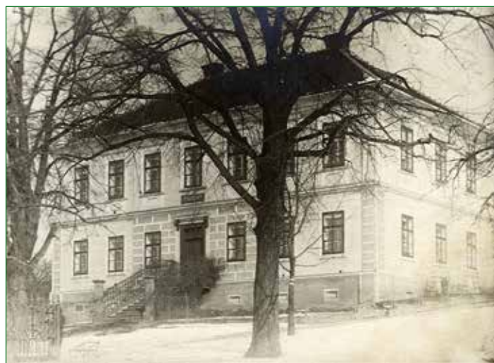
Fotografie pravděpodobně pořízena po nutných opravách školy, provedených v listopadu 1945.

Osobně si myslím, že je nejvyšší čas a zároveň poslední možnost podrobněji zmapovat život v bývalé kublovské škole. Pamětníků, kteří ji navštěvovali už mnoho není, staré fotografie a vzpomínky s nimi spojené mizí, proto chci připomenout, že 13. 10. 2025 uplynulo 147 let od